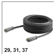
29, 31, 37